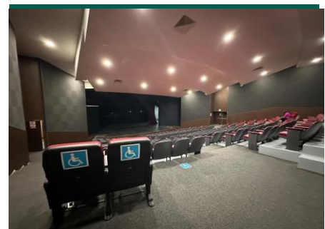
Butacas con espacios asignados a personas con discapacidad.