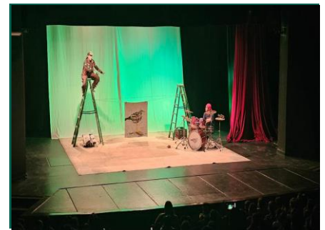
Puesta en escena "Ramiro, el pájaro que voló a la Luna".