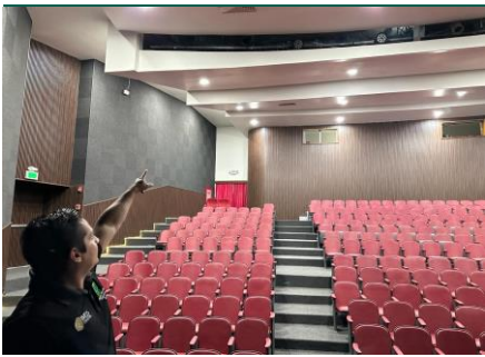
Sistema de iluminación.