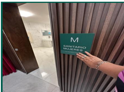
Señalización con lenguaje en Braille.